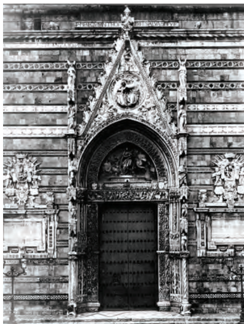
Fig. 4. Portale centrale del duomo di Messina prima del terremoto del 1908