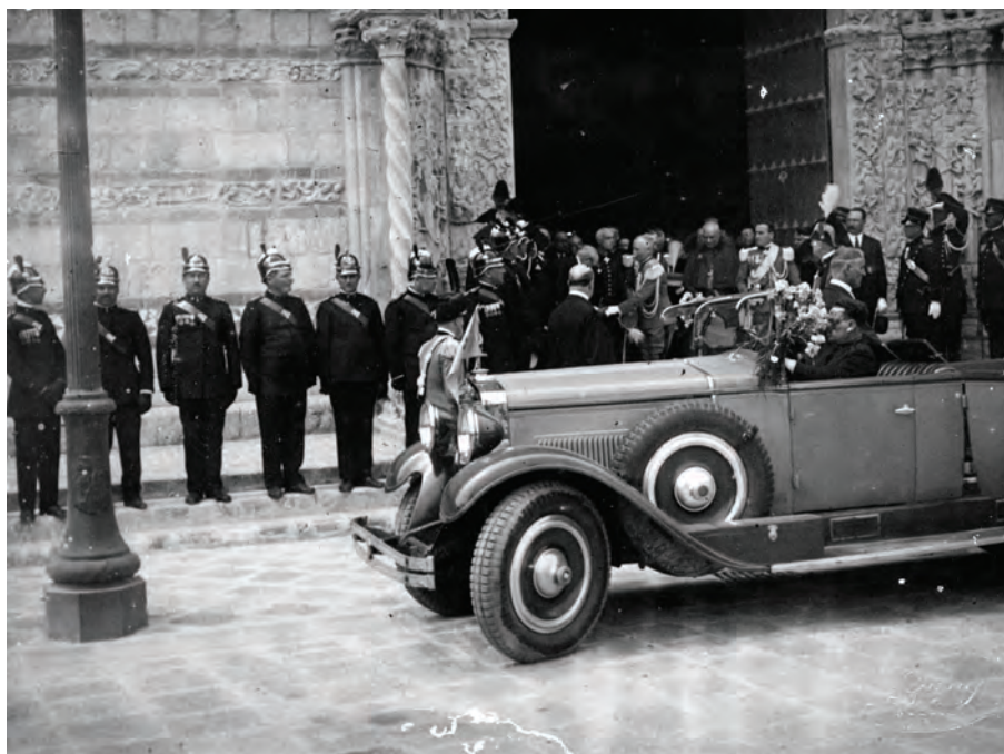
Fig. 5. L'arrivo al duomo del re Vittorio Emanuele III per l'inaugurazione del restaurato edificio il 15 agosto 1929