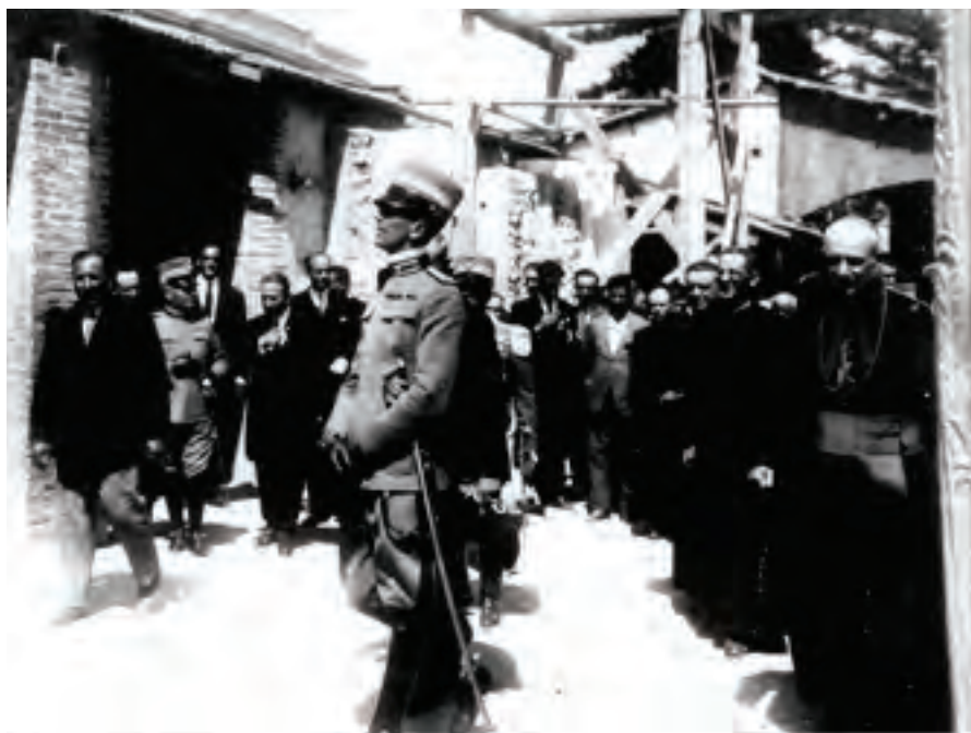
Fig. 3. Giuseppe Mannina (primo a sinistra) durante una visita del principe Umberto di Savoia (al centro) accompagnato dall'arcivescovo Paino (primo a destra) al cantiere del duomo nel 1927